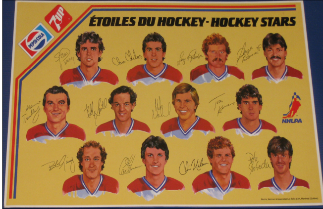
[] Hockey Stars